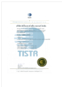
รูปภาพ : มาตรฐานการรับรอง TIS 18001 : 2554