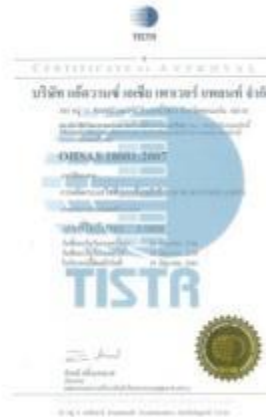
รูปภาพ : มาตรฐานการรับรอง OHSAS 18001 : 2007