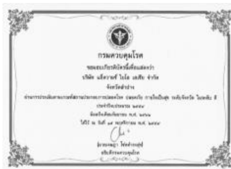
รูปภาพ : รางวัลสถานประกอบการ ปลอดภัย ปลอดภัย ใจเป็นสุข