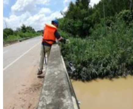
รูปภาพ: การเก็บตัวอย่างเพื่อตรวจวัดคุณภาพสิ่งแวดล้อม

มาตรฐานและการรับรองด้านการจัดการสิ่งแวดล้อม ISO 14001 : 2015 และ มาตรฐาน“รางวัลอุตสาหกรรมสีเขียว Green Industry” จากกรมโรงงานอุตสาหกรรมของกลุ่มบริษัทฯ มีดังนี้