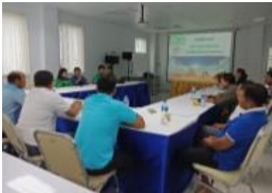
รูปภาพ : การทำกิจกรรมด้านการพัฒนาและเข้าถึงเทคโนโลยี