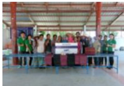
รูปภาพ : การทำกิจกรรมสนับสนุนกองทุนพัฒนาพื้นที่รอบโรงไฟฟ้า