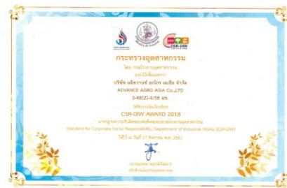
รูปภาพ: รางวัล CSR-DIW Award ประจำปี 2561