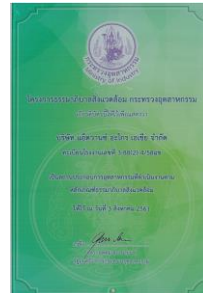
รูปภาพ: รางวัลธรรมาภิบาลด้านสิ่งแวดล้อมในสถานประกอบการ ประจำปี 2560