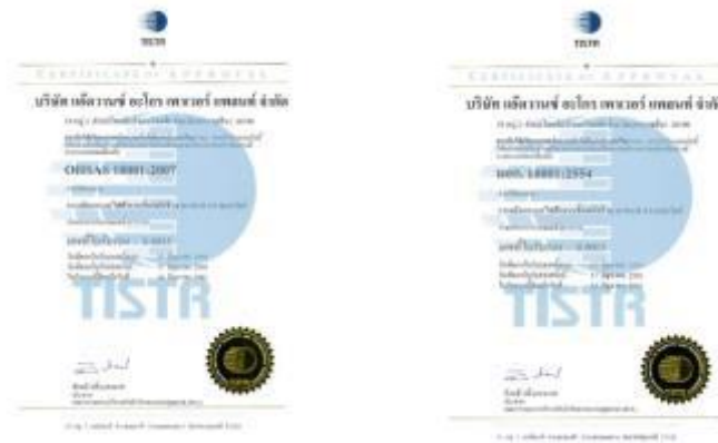
รูปภาพ : มาตรฐานการรับรอง OHSAS 18001 : 2007 และ TIS 18001 : 2554