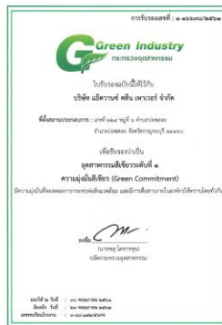
รูปภาพ: รางวัล Green Industry อุตสาหกรรมสีเขียวระดับที่ 1