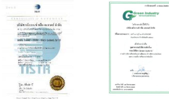
รูปภาพ: มาตรฐานการรับรอง ISO 14001 : 2015 รูปภาพ: รางวัล Green Industry อุตสาหกรรมสีเขียวระดับที่ 3