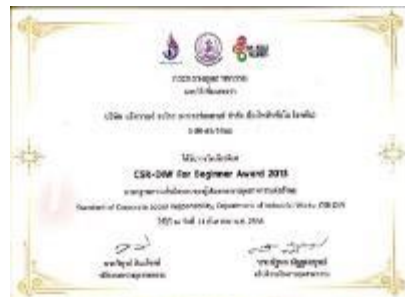
รูปภาพ: รางวัล CSR-DIW Award ประจำปี 2561