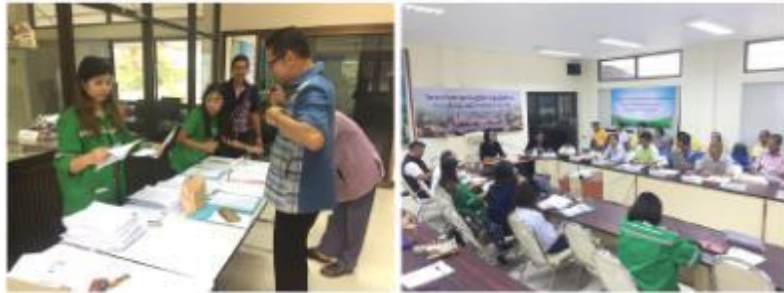
รูปภาพ : รูปกิจกรรมการจัดประชุมคณะกรรมการติดตามตรวจสอบผลกระทบสิ่งแวดล้อม