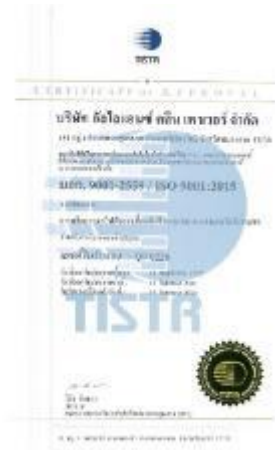
รูปภาพ : มาตรฐานการรับรอง ISO 9001 : 2015