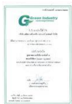
รูปภาพ: รางวัล Green Industry อุตสาหกรรมสีเขียวระดับที่ 3