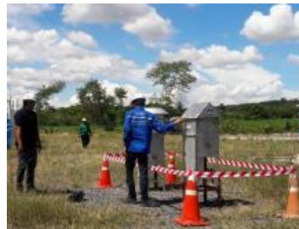
รูปภาพ: การตรวจสอบคุณภาพเครื่องจักรเพื่อควบคุมและลดมลพิษ