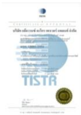
รูปภาพ : มาตรฐานการรับรอง TIS 18001 : 2554