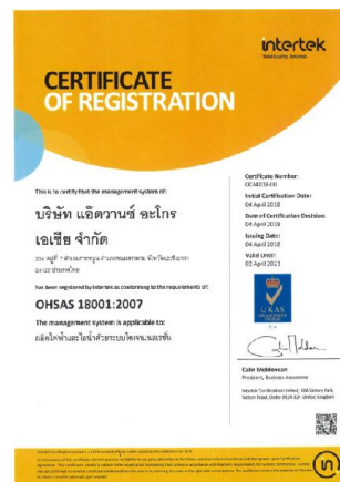
รูปภาพ : มาตรฐานการรับรอง OHSAS 18001 : 2007