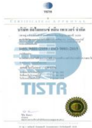
รูปภาพ : มาตรฐานการรับรอง ISO 9001: 2015