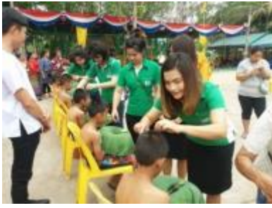
รูปภาพ : การทำกิจกรรมด้านการศึกษาและวัฒนธรรม