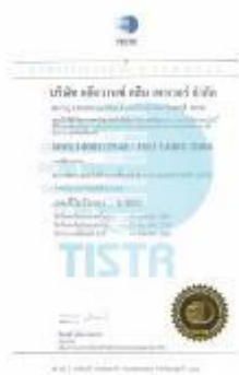
รูปภาพ: มาตรฐานการรับรอง ISO 14001 : 2004