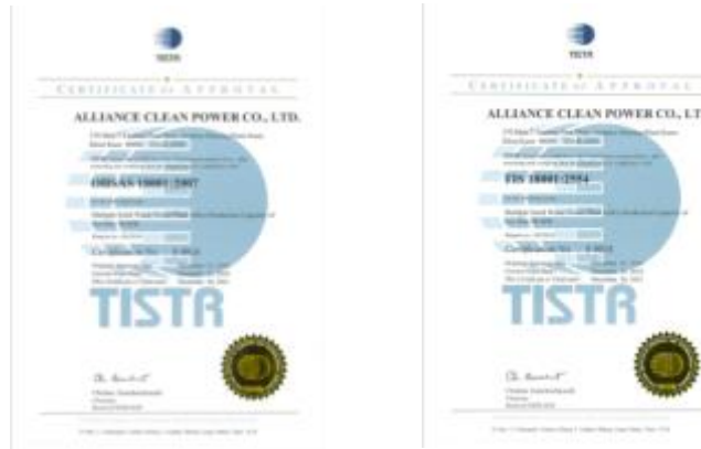
รูปภาพ : มาตรฐานการรับรอง OHSAS 18001 : 2007 และ TIS 18001 : 2554