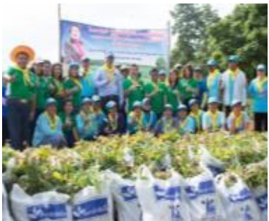
รูปภาพ : การทำกิจกรรมด้านการสร้างรายได้และส่งเสริมเศรษฐกิจ