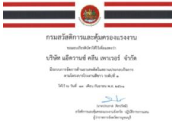
รูปภาพ : รางวัลโรงงานสีเขียว