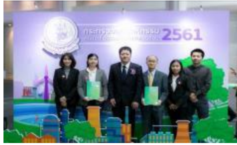
รูปภาพ: รางวัลชมเชยด้านสิ่งแวดล้อมในสถานประกอบการ ประจำปี 2561 ต่อเนื่องปีที่ 3