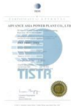
รูปภาพ: มาตรฐานการรับรอง ISO 14001 : 2015