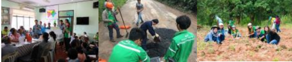
รูปภาพ: กิจกรรมการมีส่วนร่วมพัฒนาชุมชนในพื้นที่ใกล้เคียง