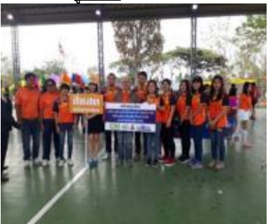
รูปภาพ : การทำกิจกรรมด้านสุขภาพ