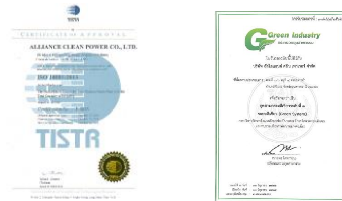
รูปภาพ: มาตรฐานการรับรอง ISO 14001 : 2015 รูปภาพ: รางวัล Green Industry อุตสาหกรรมสีเขียวระดับที่ 1