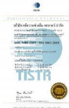
รูปภาพ : มาตรฐานการรับรอง ISO 9001 : 2015