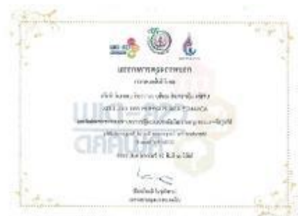
รูปภาพ: รางวัล CSR-DIW Award ประจำปี 2555