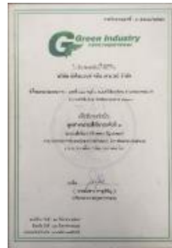
รูปภาพ: มาตรฐานการรับรอง ISO 14001 : 2015 รูปภาพ: รางวัล Green Industry อุตสาหกรรมสีเขียวระดับที่ 3