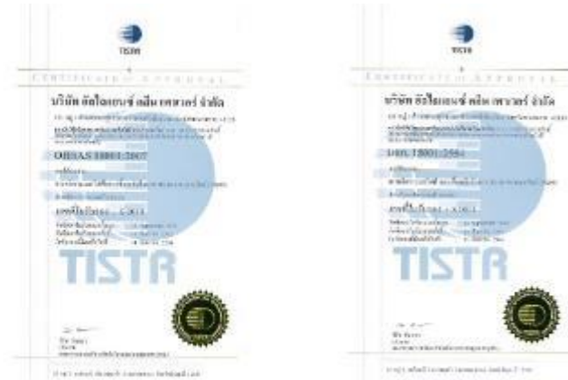
รูปภาพ : มาตรฐานการรับรอง OHSAS 18001 : 2007 และ TIS 18001 : 2554