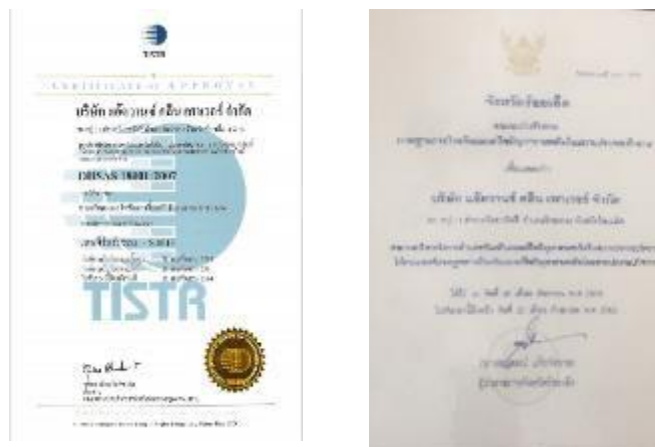
รูปภาพ : มาตรฐานการรับรอง OHSAS 18001 : 2007 รูปภาพ : มาตรฐานการป้องกันและแก้ไขปญหาเสพตติ ในสถานประกอบกิจการ