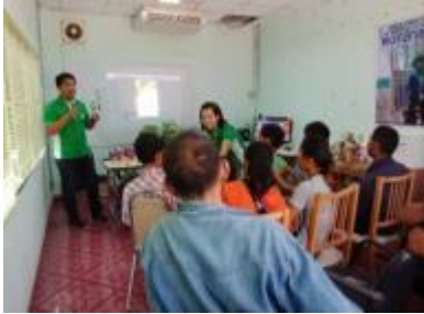
รูปภาพ : การทำกิจกรรมด้านการสร้างงานและการพัฒนาทักษะ