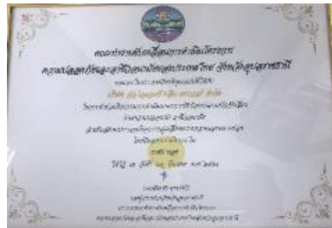
รูปภาพ : รางวัลความปลอดภัยของสถานประกอบการ กลุ่มเสี่ยงขนาดกลางและขนาดย่อม