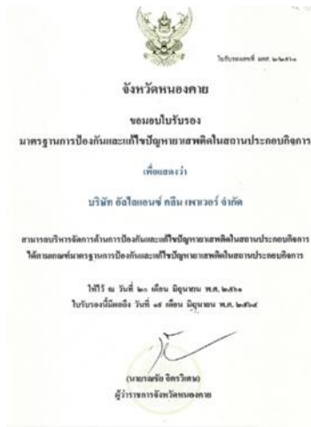
รูปภาพ : มาตรฐานการป้องกันและแก้ไขปญหาเสพตติในสถานประกอบกิจการ