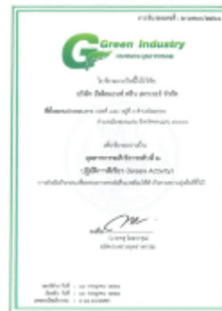
รูปภาพ: มาตรฐานการรับรอง ISO 14001 : 2015 รูปภาพ: รางวัล Green Industry อุตสาหกรรมสีเขียวระดับที่ 2