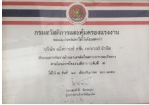
รูปภาพ : รางวัลโรงงานสีขาว