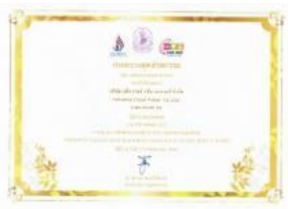
รูปภาพ: รางวัล CSR-DIW Continuous ประจำปี 2561