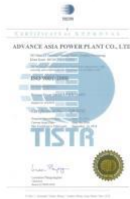
รูปภาพ : มาตรฐานการรับรอง ISO 9001 : 2008