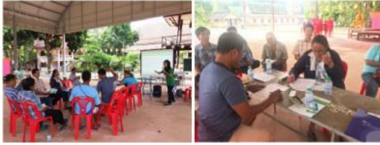
รูปภาพ : รูปกิจกรรมสานเสวนาชุมชน กิจกรรมประชามหุ่บ้าน

นอกจากนี้ กลุ่มบริษัทฯ ยังได้จัดและเข้าร่วมกิจกรรมกับชุมชนที่หลากหลาย พร้อมทั้งส่งเสริมการสร้างงาน สร้างอาชีพ ให้กับชุมชน และประเทศชาติโดยส่วนรวม ดังนี้