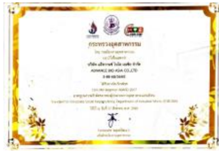
รูปภาพ: CSR-DIW for Beginner ประจำปี 2560