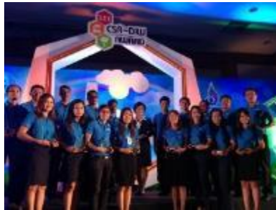
รูปภาพ: รางวัล CSR-DIW for Beginner ประจำปี 2556