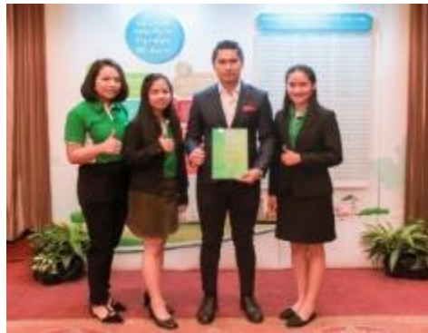
รูปภาพ: รางวัลชมเชยด้านสิ่งแวดล้อมในสถานประกอบการ ประจำปี 2560