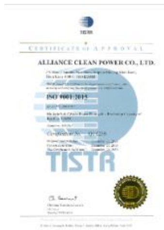
รูปภาพ : มาตรฐานการรับรอง ISO 9001 : 2015