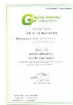
รูปภาพ: รางวัล Green Industry อุตสาหกรรมสีเขียวระดับที่ 3