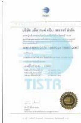
รูปภาพ : มาตรฐานการรับรอง TIS 18001 : 2554