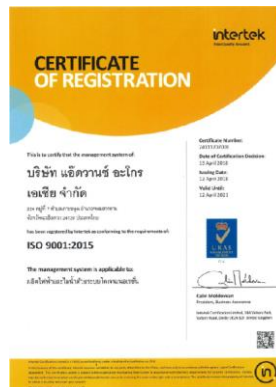
รูปภาพ : มาตรฐานการรับรอง ISO 9001 : 2015